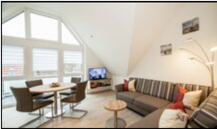
Willkommen in unserer Ferienwohnung