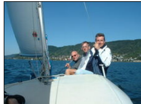
Segeln auf dem Bodensee

Bodman liegt am westlichen Ende des Bodensees. Eingebettet in eine herrliche Hügellandschaft, angrenzend an ein ausgedehntes Naturschutzgebiet. Unter Kennern zählt diese Ecke, mit ihrer Vielzahl an seltenen Pflanzen und Vögeln, zu den schönsten des Bodensees. Es ist eine liebevolle Erholungslandschaft, die das ganze Jahr über zu entdecken lohnt (Auszug aus der Information des Verkehrsamtes).