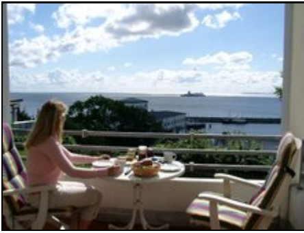
Meerblickfrühstück in allererster Reihe!