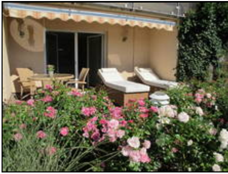
Terrasse Ferienwohnung Fasse