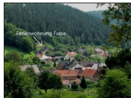
Blick auf Delliehausen

Eingebettet zwischen der Bergwelt des Harzes und der traumhaften Landschaft des Weserberglands ist Delliehausen idealer Ausgangspunkt für zahlreiche Attraktionen und sportliche Aktivitäten wie Wandern, Radfahren (der beliebte Weserradweg ist nur ca. 20 km