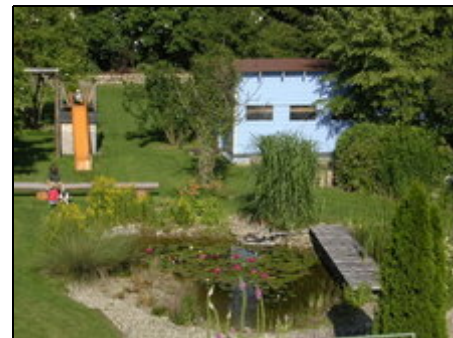
Garten so weit das Auge reicht

Rad- und Wanderwege entlang von Flussläufen und Badeseen liegen direkt am Ort. Ein 25-meter-hoher Aussichtsturm bietet eine herrliche Sicht über die Donauauen, in die schwäbische Alb und bei guter Fernsicht bis in die Alpen. Freizeitbäder finden Sie in Leipheim (12 Km) und in Neu-Ulm (30 km) Badesee "Silbersee" 3 km Legoland 10 Km Augsburg (Puppenkiste Altstadt)- 40 Km Ulm (Münster/Altstadt) 30 Km, München 100 km Günzburg 10 km Giengen, Tropfsteinhöhle, Steiff-Museum 35 km