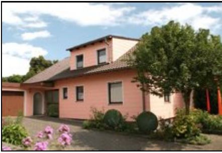
Herzlich willkommen in der Ferienwohnung