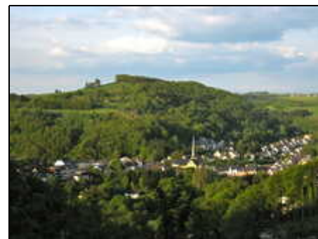
Waxweiler- Unser Dorf hat Zukunft-2012

Natürlich kann man auch golfen, klettern, schwimmen und angeln.