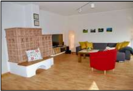
Das frisch renovierte Wohnzimmer