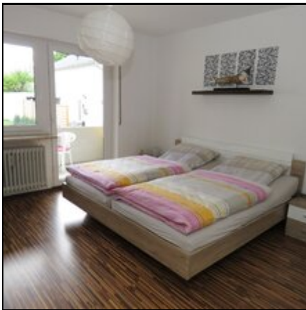
Willkommen in der Ferienwohnung :-)