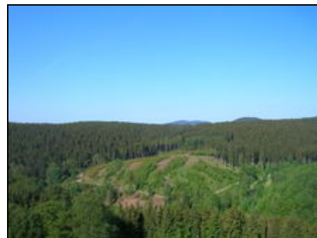
Blick vom Balkon des Apartments

Spielen Sie Billard im Erdgeschoss des Hauses oder Minigolf in den Außenanlagen. Wandern Sie durch die sauerstoffreichen Wälder zur Wolfsbachmühle, zum "Neuen Teich" oder auf den Brocken. Spazieren Sie durch den Kurpark. Besichtigen Sie traumhaft romantische Fachwerkhäuser in historischen Altstädten wie Quedlinburg, Goslar oder Wernigerode. Laufen Sie Ski über frisch gespurte Loipen in frischer klarer Winterluft. Oder lassen Sie sich einfach bei einer Massage im Panoramic verwöhnen. Der Harz hat viel zu bieten!