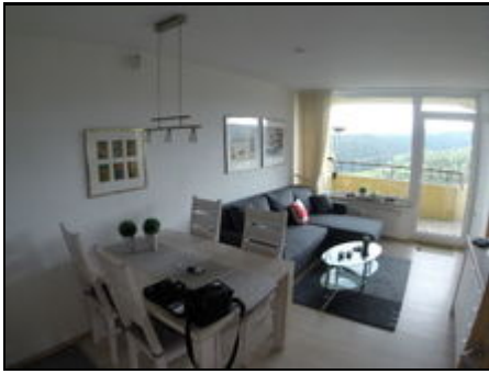
Blick in den gemütlichen Wohnbereich