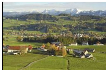
Weiler im Allgäu

Im Sommer lädt die Bergwelt der Allgäuer Alpen zu Wander- und Entdeckungstouren ein. Die Sommer-Rodelbahn "Hündle" bei Oberstaufen ist mit dem Auto in 25 Minuten zu erreichen. Der Bodensee ist ebenfalls nur 25 Autominuten entfernt. Im Winter gibt es - soweit es die Witterung zulässt - diverse Langlaufloipen am Ort und auch einige kleinere Skilifte in der näheren Umgebung. Für "Fortgeschrittene" sind diverse Skigebiete in der näheren und weiteren Umgebung gut erreichbar