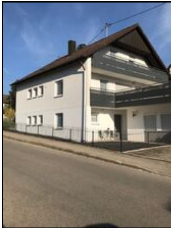
Das Ferienhaus Josefine