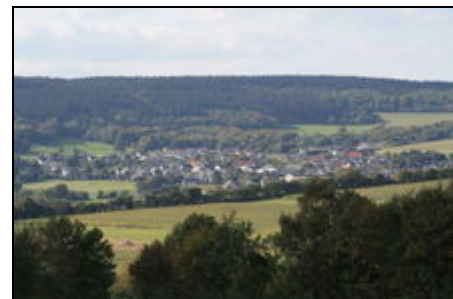
Gesamtansicht von Spessart

Durch die zentrale Lage von Spessart erreichen Sie in 15 Autominuten z.B. die Ahr, das Kloster Maria Laach, die Hohe Acht und den Nürburgring. Auch Rhein oder Mosel mit interessanten Sehenswürdigkeiten wie z.B. Burgen und Schlössern sind nur 30