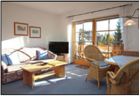
Ferienwohnung Hörnerblick 32