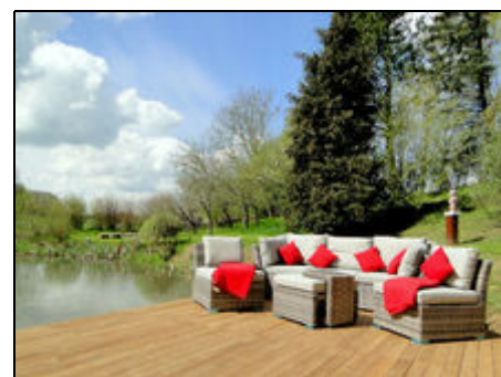
Stegtterrasse am Gartenteich

Das Zentrum Kappeln ist fußläufig in wenigen Minuten zu erreichen. Kappeln bietet neben den Sehenswürdigkeiten (Schlei-Brücke, Heringszaun, Sankt-Nikolaikirche, Museumshafen) ein vielfältiges Gastronomieangebot und viele kleine Läden und Boutiquen, die einen schönen Stadtbummel ermöglichen. Fisch-Fans sollten unbedingt die Fischräucherei Föh besuchen, für Naschi-Liebhaber empfiehlt sich ein Besuch der Schokoladenküche. Von hier aus sind die schönen Ostseestrände nur 6-7 km entfernt und eignen sich nicht nur für ein erfrischendes Bad, sondern auch für ausgiebige Spaziergänge und Radtouren, die Schlei ist nur 2-3km entfernt