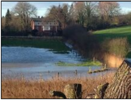
Ferienhaus NATÜRLICH Wassermühle