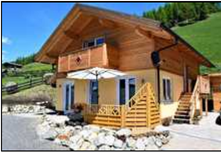
Chalet Magda mit Eingangsbereich Apartme