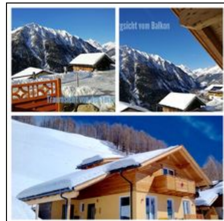
Lage und Aussicht Chalet Magda-Lena

In 1,5 Std Millstättersee oder Bad Gastein