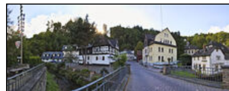
idyllisch in Grenzau gelegen, nahe A48

Genießen sie die Natur beim Wandern, Radfahren oder Nordic Walking. Tanken sie Energie bei einem Wellnessstag in der Sauna. Trainieren Sie mit den Profis in der Tischtennisschule TTC Grenzau o. Base Tennis am Moorsberg. Besuchen Sie das Keramikmuseum und entdecken Ihr Talent in einem Töpferkurs. Außerdem laden Rhein und Mosel zu Burgen und Schlossbesichtigungen ein. Termine 2016: Keramikmarkt, Rhein in Flammen Koblenz, Handwerkermarkt, Limesfest in Hillscheid, Töpfermarkt in Ransbach - Baumbach