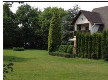
Grundstück/Garten /Fewo 1. OG