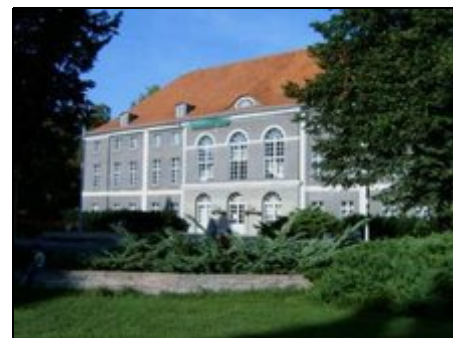
Schloss Schönhausen (vor d. Renovierung)

Alex, Friedrichstraße, Potsdamer Platz & Zoo mit Bus & Bahn in ca. 30 min erreichbar