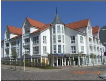
Sellin, Haus Baltic