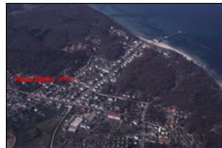
Luftbild Sellin Haus Baltic

Sellin ist das zweitgrößte Ostseebad auf Rügen. Die Seebrücke mit Schiffsanleger am Hochufer ist eine besondere Attraktion. Mit einer Tauchgondel können Sie trocken den Fußes in der Ostsee versinken. Einen ausgedehnten Buchenwald und die zahlreichen Geschäfte sowie das attraktive Erlebnisbad können Sie zu Fuß erreichen. Fahrräder können im Ort geliehen werden.