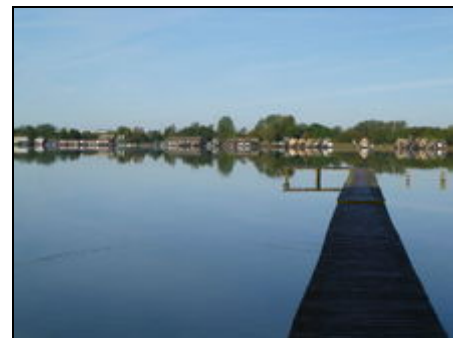
Insensee mit Badestrand