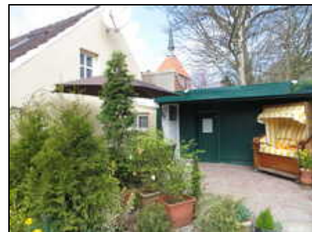
Hof mit Sitzgarnitur und Strandkorb

Genießen Sie die ausgezeichnete Gastronomie in der Krummhörn und