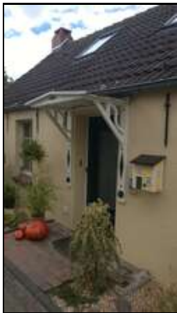
Eingangsbereich, Ferienhaus, Nordsee