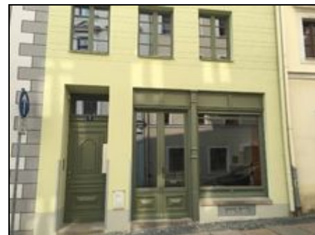
Der Eingang zur Bogstrasse 2 in Görlitz

Ankommen und Wohlfühlen .. im Appart.Bog 2, ein guter Ausgangspunkt für die Erkundung der faszinierenden Stadt Görlitz, dem größten geschlossenen Städtedenkmal Deutschlands.