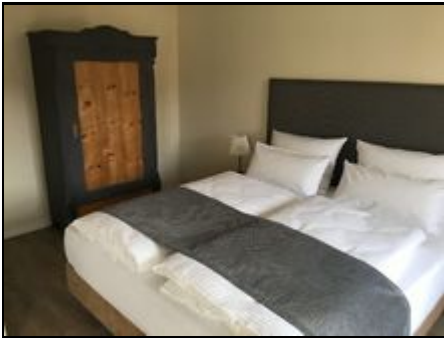
Schlafzimmer des Appartements Kamenz