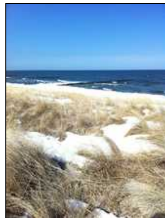
Wenningstedter Strand und Dünen

Das Restaurant "Fitschen am Dorfteich" sowie Gosch sind von unserer Wohnung aus perfekt erreichbar. Eine Minigolf-Anlage in Wenningstedt sowie ein Kinderspielplatz fast am Dorfteich gelegen sind für Kinder und Jugendliche