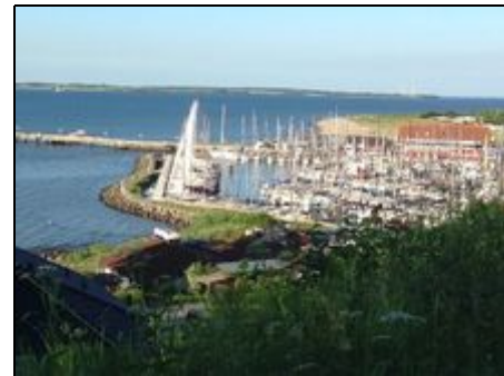
Fischerei- und Yachthafen Langballigau

Ob ausgedehnte Spaziergänge im Tal der Langballigau, ausgiebige Fahrradtouren in der schönen Angeliter Landschaft, eine Schifffahrt nach Sonderburg Dänemark, ein Besuch im Landschaftsmuseum Unewatt, ein Wellness Besuch in der Fördelandtherme Glücksburg oder ein Besuch der schönen Hafenstädte Flensburg ca. 18km oder Kappeln ca. 28 km, es ist für jeden etwas dabei.