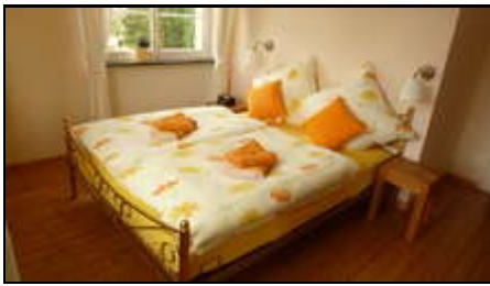
Romantische Ferienwohnung Engelstube