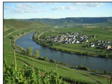
Blick auf Köwerich, Mosel und Weinberge

Nähe Trier: Der idyllische Weinort Köwerich liegt umgeben von Weinbergen an der Mosel zwischen der Römerstadt Trier (25 km), Bernkastel-Kues (30 km), Koblenz (110 km) Freizeitmöglichkeiten: Radfahren auf den Radwegen der Röm. Weinstraße, Schifffahrt auf der Mosel, Wandern entlang der Weinberge, Ausflüge nach Trier, Bernkastel-Kues, Idar-Oberstein, Eifelmaare, Luxemburg, Golfen, Schwimmbad/Sauna, Weinproben, Weinfeste... Genießen Sie die Ruhe der Mosellandschaft und den Flair des milden Klimas