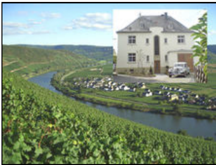
Altes Pfarrhaus in Köwerich/ Mosel