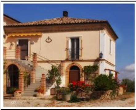
La Casa Antica Hausansicht