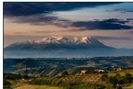
Panoramablick Casa Antica

Egal, ob Ihr spazieren gehen, wandern, Rad fahren oder auch klettern wollt; bei uns habt Ihr nicht nur die Möglichkeit, sondern auch die spektakuläre Kulisse dafür!