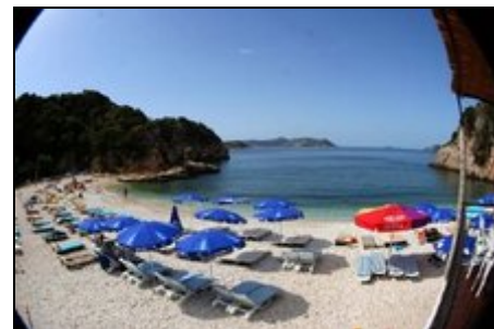
Kieselstrand Büyük Cakil

Früher ein Geheimtip für Individualurlauber, blieb Kas bisher noch von dem in der Türkei üblichen Massentourismus verschont.