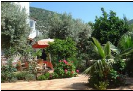
Gemütliche Grillecke im Garten