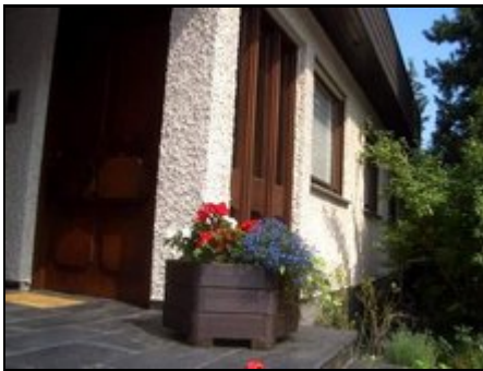
Eingang unseres Hauses