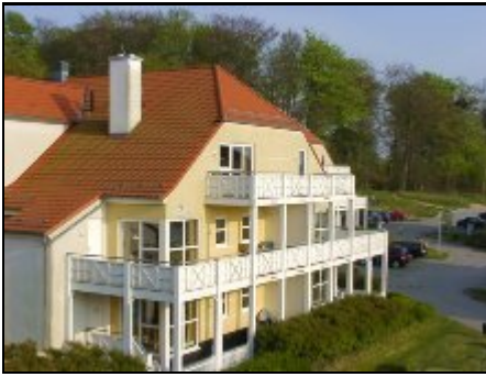
Außenansicht, Sie wohnen ganz oben