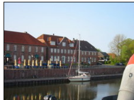
Spaziergang zum alten Hafen von Hooksiel

Hooksiel selbst ist ein kleines Fischerdorf, welches mit seinem alten Hafen, den alten Fischerhäusern, Wirtshäusern und Geschäften zum Verweilen einlädt. Der schöne Hooksiel Strand ist in Textil- und FKK-Bereich unterteilt. Hooksiel ist ein Eldorado für Surfer u. Wasserski. Geführte Wattwanderungen und spezielle Schifffahrten runden das Angebot ab. Radwege beginnen direkt vor dem Haus und für Tagesausflüge laden zahlreiche schöne Städte in der Umgebung ein, wie z.B. Jever und Wilhelmshaven.