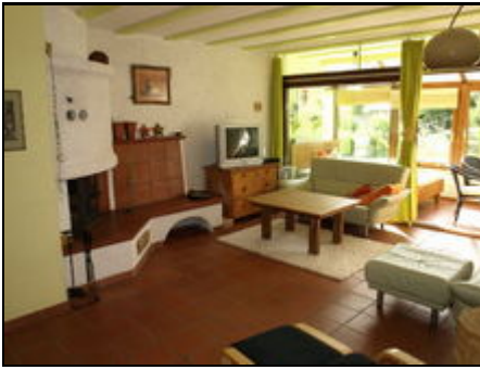
Wohnzimmer mit Wintergarten