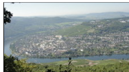
Moselschleife mit Blick auf Kues

Bernkastel liegt im Herzen der Mittelmosel. Sie finden hier die moseltypischen Fachwerkbauten und können sich in zahlreichen Museen die Geschichte der Region anschauen. Bezaubernde Landschaft, hübsche Straußwirtschaften, gute Gastronomie, Wander- u. Radwege. Ausflüge nach Trier, Luxemburg, Edelsteinstadt Idar-Oberstein oder auch eine Tagesfahrt nach Paris bereichern Ihren Urlaub. Die nahegelegene Eifel mit Vulkanseen lockt zum Wandern und Baden. Der Maare-Mosel-Radweg beginnt 100m entfernt von uns