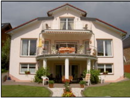
Erdgeschoß überdacht.Terrasse sep. Eingang