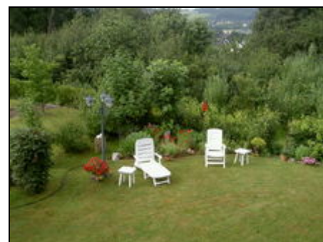
Unsere liegewiese im Juni 2011